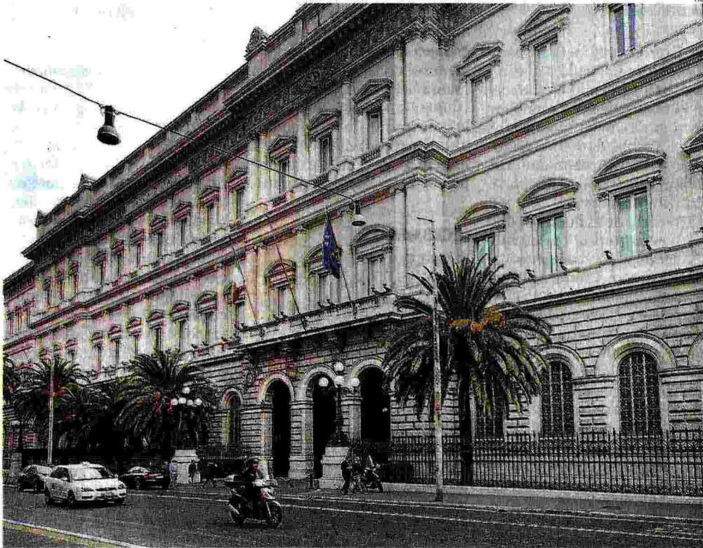
La vendita delle quattro Good bank. La sede della Banca d'Italia